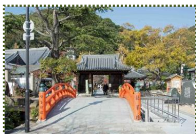
写真-5 須磨寺参道(龍華橋の向こうは仁王門)

毎月20日、21日の“お大師さん ※2 ”には参道に屋台が出て多くの人で賑わいます。(筆者が住んでいた頃は21日だけ)