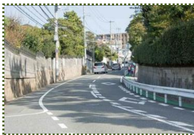
写真-10 大池東の道路下が千森川暗渠 （中流部）