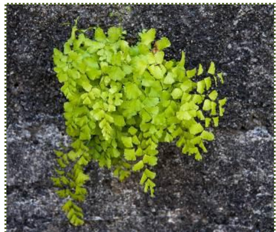
写真-16 ハウライシダ

ハウライシダ科ハウライシダ属のシダ植物で常緑性の多年草。岩などに固着して生育する。形態の美しさから観賞用に栽培されることがあるが、その際には、総称として属名のアジアタムと呼ばれることもある。栽培はそれほど容易ではなく、排水や保水の良い用土、適切な湿度調整などが求められる。兵庫県下では南部を中心として、市街地の溝や湿った石垣から山中の砂防ダムの壁面にまで自生・群生しているのが見られる。右は、須磨寺近くの溝の古くなったコンクリート壁に着生していたもの。