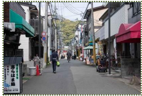
写真-15 須磨寺商店街

千森川が暗渠だったことは小学生の頃から知っていました(道路上を歩いていると、下から水の流れる音がする)が、小屋ヶ谷川の一部が暗渠だったことは今回初めて知りました。そういえば、その小屋ヶ谷川暗渠部付近に昭和30(1955)年頃、神戸土木出張所(現・神戸土木事務所)があったことを思い出しました。