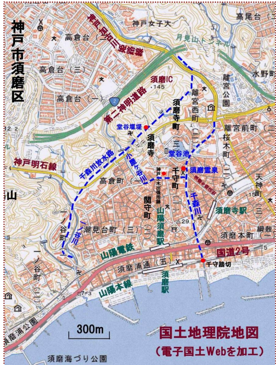
図-1 千森川周辺の地図