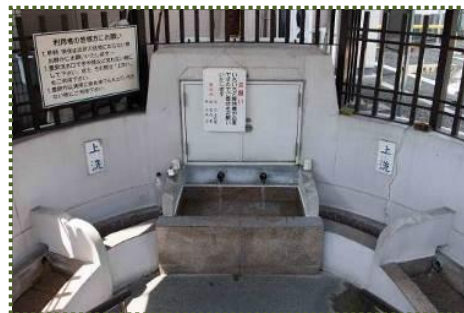
写真-14 須磨霊泉（湧出口から上洗、下洗へと流れている）

ただ、神戸市が10年以上前から水質検査を実施していますが、大腸菌がたびたび検出され飲用不適になっていることから、飲む場合は必ず十分に煮沸してください、との注意書きがありました。また、今もそれなりの水量が出ていますが、以前に比べ水量が減少しているような気がしています。