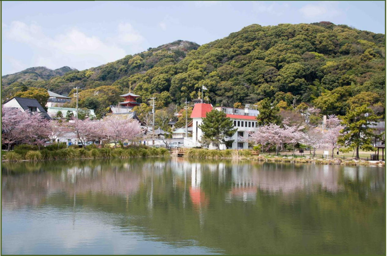
写真-1 大池越しに須磨寺を撮影（令和4年4月）