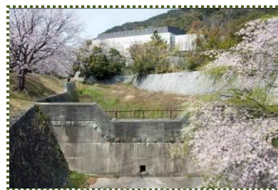
写真-11 神戸女子大横を流れる千森川 （上流部）