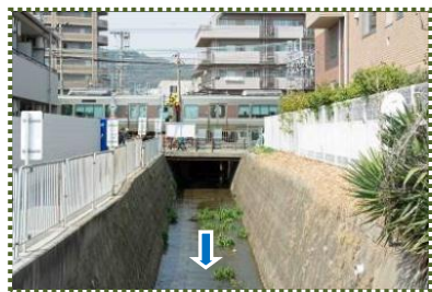
写真-9 JR千守踏切下で開渠となる千森川 （河口部）

この溪流の水は大池に流入し、池の洪水吐（写真-8）から近くの道路下の千森川（暗渠）に流れ込んでいます。