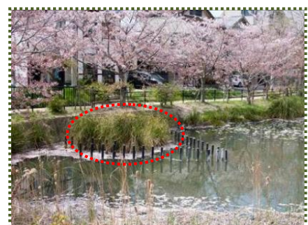
写真-8 大池の洪水吐

昭和 36（1961）年には池畔に温泉が発見され、須磨温泉として今も湧出しているようです。ただ、温泉湧出以前から池の周りにあった 2 軒の旅館（たしか「寿楼」と「延命軒」）は、「寿楼」だけになっています。