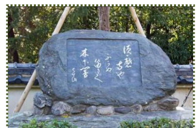
写真-7 芭蕉の句碑(須磨寺ゆ 心かぬ笛きく木下闇)