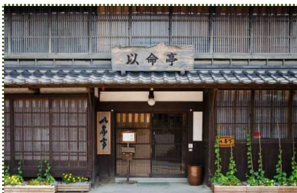
写真-5 浜坂先人記念館「以命亭」

放水路の完成により旧河道となった味原川には、「川途（かわと）」と呼ばれる約 500m の川沿いの道があります。今、この道沿いに、「加藤文太郎 *1 記念図書館」（平成 6 年開館）や浜坂の地が輩出した先人の足跡を紹介する「浜坂先人記念館・以命亭（いめい亭） *2 」（平成 4 年開館）が整備され、案内板や木製のベンチ、橋などが設けられ、川途は「あじわら小径（こみち）」と呼ばれる散歩道になっています。