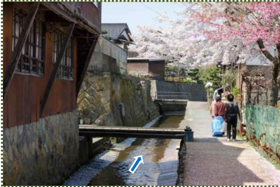
写真-15 あじわら小径と味原川旧河道

「あじわら小径」沿いには、江戸期の繁栄が偲ばれるような立派な石垣がある一方で、コンクリートブロックの擁壁、朽ちはじめた板塀、剥げかけの白壁があったりして、きびしい現実も目にします。せっかく歴史的景観形成地区に指定されているので、息の長い取り組みになるとと思いますが、いずれは風情のある石積みや板塀、白壁が再現されることを願っています。