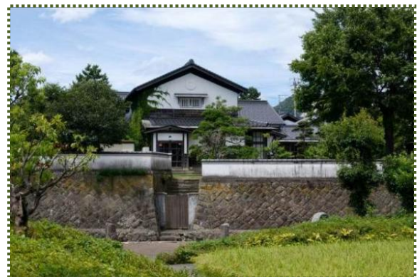
写真-6 加藤文太郎記念図書館から「以命亭」を撮影

その味原川沿いには、湧出する豊富な伏流水を利用して、明治 10（1877）年頃には何と 22 軒の造り酒屋がありました。そのうちの 1 軒が七釜屋森家です。