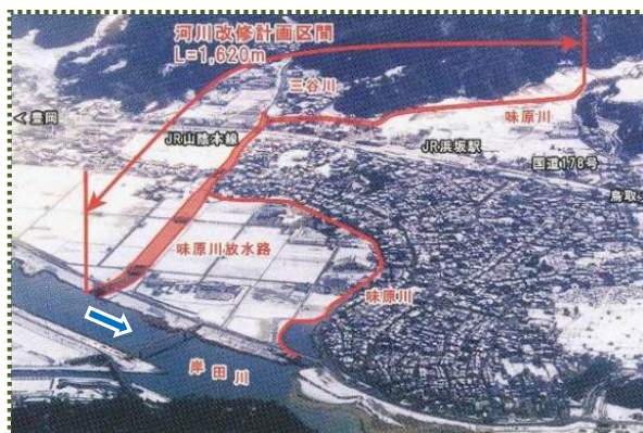
写真-2 味原川改修計画

そして、町が計画中の公共下水道「浜坂浄化センター」とも調整しながら計画をまとめあげ、平成4（1992）年度に広域基幹河川改修事業として採択されました。