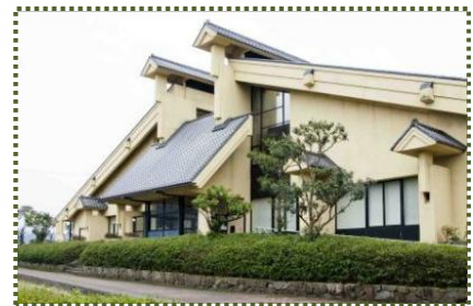
写真-8 加藤文太郎記念図書館

※1 加藤文太郎：明治 38 (1905) 年～昭和 11 (1936) 年。新温泉町浜坂出身の登山家。パーティーを作って登るのが常識とされる山岳界の常識を覆し、単独行によって数々の登攀記録を残した。登山に対する精神と劇的な生涯から、新田次郎の小説『孤高の人』のモデルとなった。大正 12 (1923) 年頃から本格的に登山を始める。当時、須磨に住んでいて六甲山が目と鼻の先にあったことから、現在ではポピュラーとなった六甲全山縦走を始めている。歩くスピードが非常に速く、早朝に須磨を出て六甲全山を縦走し、宝塚に下山した後、その日のうちに、また歩いて須磨まで帰って来たという。距離は約 100km に及ぶ。(六甲全縦を3回経験している筆者でもわかには信じがたい。) 昭和 11 (1936) 年 1 月、数年来のパートナーであった吉田富久と共に槍ヶ岳北鎌尾根に挑むが猛吹雪に遭い天上沢で 30 歳の生涯を閉じる。