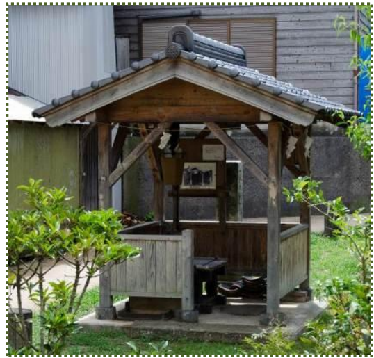
写真-7 復元された井戸場

豊富な湧水は、人々の暮らしにも深く関わっていました。湧水を利用した共同の井戸場が多数あって、人々は野菜や食器を洗ったり、洗濯などに利用したりして、井戸場は地元のおばさんたちの社交場でもあったそうです。昭和 40 年代以降水道の整備により、ほとんどの井戸が埋められてしまいましたが、平成 18 (2006) 年にかつての井戸場に屋根付きの木造上屋と、井戸場につながる木橋が整備されました。