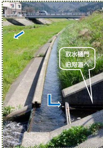
写真-3 味原川旧河道への取水樋門

なお、味原川旧河道は沿川市街地の雨水だけを受け持つとともに、平常時は下の写真-3 のように堤外水路で水を引き、取水樋門から維持用水を取り入れています。