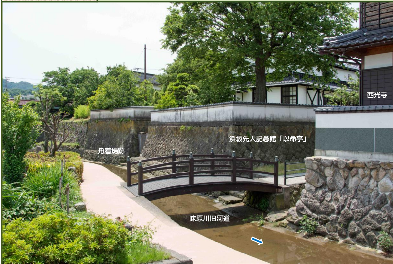
写真-1 あじわら小径沿いを流れる味原川旧河道（平成27年6月撮影）