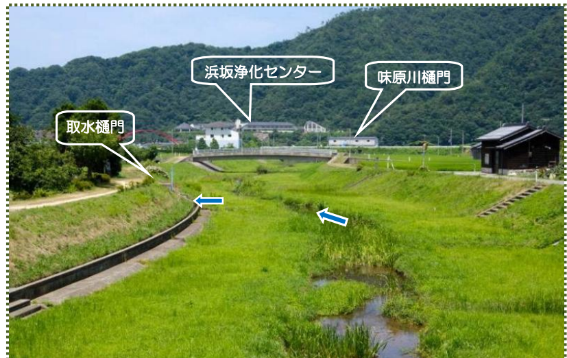
写真-4 白川橋から味原川放水路を撮影