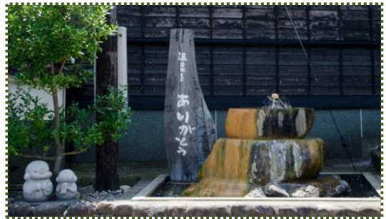
写真-12 旧県道沿いにある浜坂温泉源泉塔

その後、町が掘り進め、昭和 57 (1982) 年 6 月から浜坂市街地の約 800 戸に配湯、家庭温泉の夢を実現し、健康増進、省エネに大きな役割を果たしています。