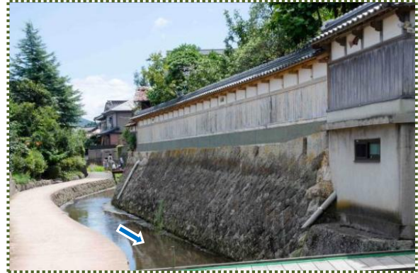
写真-16 あじわら小径と味原川旧河道