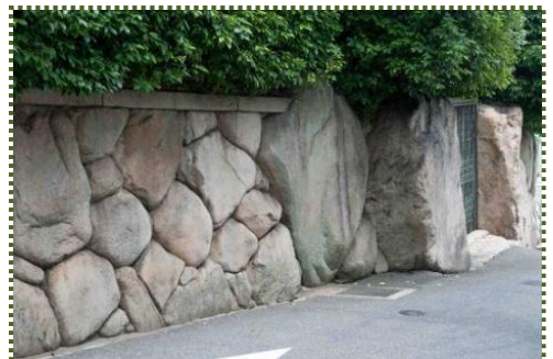
写真-2 流れて来た巨石で築いた石垣（東灘区住吉本町）

右の写真-2のような石垣が続く街並みは、記念碑以上の迫力をもって、山津波の恐ろしさを今に伝えています。