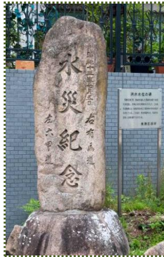
写真-3 『水災紀念』石碑正面

なお、石碑は道標も兼ねていて、「水災紀念」の文字の両側に「右有馬道 左六甲道」と刻まれています（写真-3）。