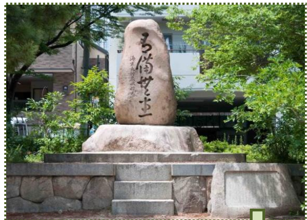
写真-5 野寄公園内にある『有備無患』の碑

※1 末次信正（すえつぐのあまさ）：1880～1944 年。山口県に生まれる。海軍軍人・政治家。昭和 9 (1934) 年 3 月海軍大将に就任。昭和 12 (1937) 年 12 月の第 1 次近衛内閣では内閣参議から治安の最高責任者たる内務大臣に就任。その半年後に阪神大水害が発生し、現地を視察している。なお、第 3 次近衛内閣が退陣した昭和 16 (1941) 年 10 月、末次は全国治水砂防協会会長であった。