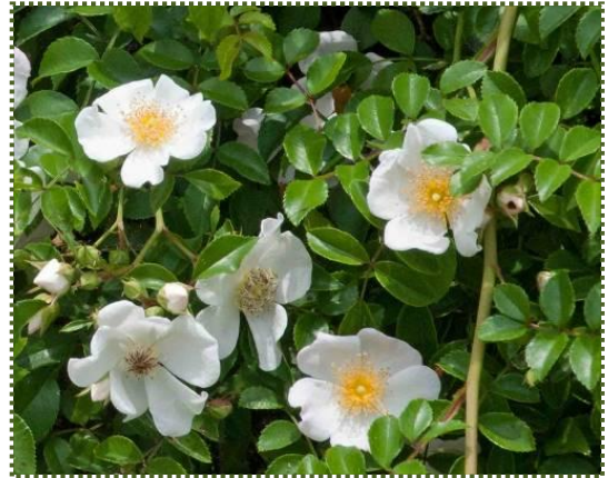
写真-10 住吉川の護岸に垂れ下がるように咲いていたナニワイバラ（写真-1も参照）

バラ科バラ属で、名は江戸時代に大坂（難波）の植木商人が中国から輸入して広めたためこの名が付いた。5月～6月に芳香がある白い花を咲かせるツル性の常緑低木。ツルから伸びた小枝に、かすかに梅の花に似た香りのある花が付く。花弁は5枚。ハート型のやや厚みのある白い花弁で、大きさは約6～8cmと大き目。茎は10mにもなり、生育も早く1年で50cmくらい伸びることもある。ツル性なので壁や柱などに添って上に伸び、茎にはかぎ状の強いトゲがある。葉は深緑色で光沢があり、バラの中では固めである。冬に落葉することはなく、小葉は3～5枚、長めの楕円形で長さ3～5cmである。丈夫で耐寒性があり良い香りがある。オーキッドコート前の住吉川護岸に道路から垂れ下がるように咲いていた（写真-1&10参照）。