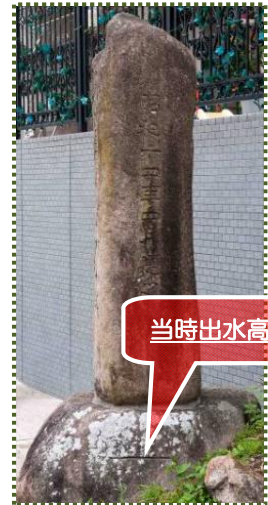
写真-4 『水災紀念』石碑右側面