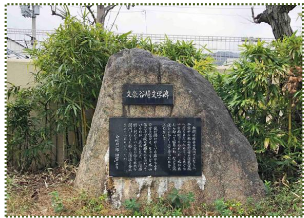
写真-9 文豪谷崎文学碑

築山はその後なくなりましたが、昭和60（1985）年、谷崎潤一郎の生誕百年を記念してか、残された石に小説『細雪』の一節を刻んで『文豪谷崎文学碑』（写真-9）が建てられています。