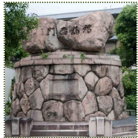
写真-6 住吉学園内の『禍福無門』の碑

碑に用いた巨石は水害時のままの状態で台座を築いているようで、土砂で埋まってしまった当時の状況を伺い知ることができます。「濁流土砂奔馬ノ如ク荒し狂瀾怒涛幾千貫ノ巨巖唸リヲ生ジテ飛ビ…」という碑文とともに当時の山津波のすさまじさを伝えています。