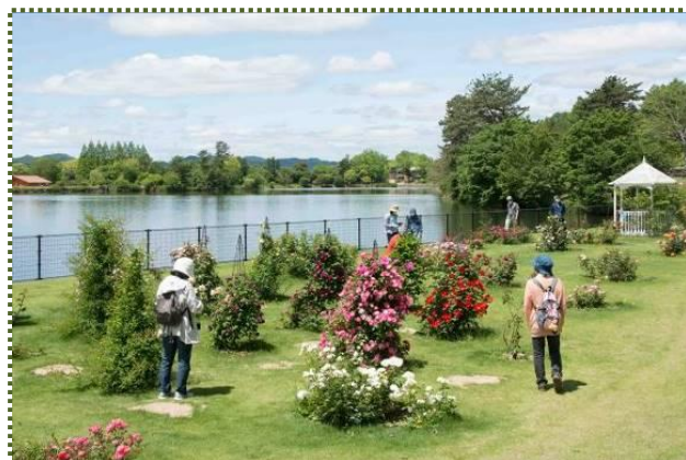
写真-2 県立フラワーセンター・ばら園（フェンスの向こうは亀ノ倉池）

※1 兵庫県立フラワーセンター：全国でも有数の花の公園で、前身は県立農業試験場フラワーセンターである。花に関する知識の普及および栽培技術の向上と憩いの場を提供する公園機能を兼ね備え、併せて潤いのある郷土づくりと花と緑を普及する拠点施設として、昭和48（1973）年建設に着手し、昭和49（1974）年9月に無料開園、昭和51（1976）年4月に有料開園した。園内中央に亀ノ倉池を配し、背に飯盛山を取り込み、約46ha（亀ノ倉池約7haを除く）に及ぶ松の自然林をそのまま生かしている。大温室や大小様々な花壇・樹木園で構成されていて、中央花壇、四季の花壇、風車前花壇等に季節毎に植えられる草花の数は年間60万株に及ぶ。管理者は、公益財団法人兵庫県園芸・公園協会。