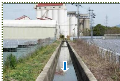
写真-7 疏水路 (第1分水口南)