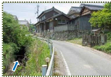
写真-8 隧道入口部 (隧道L=50間)