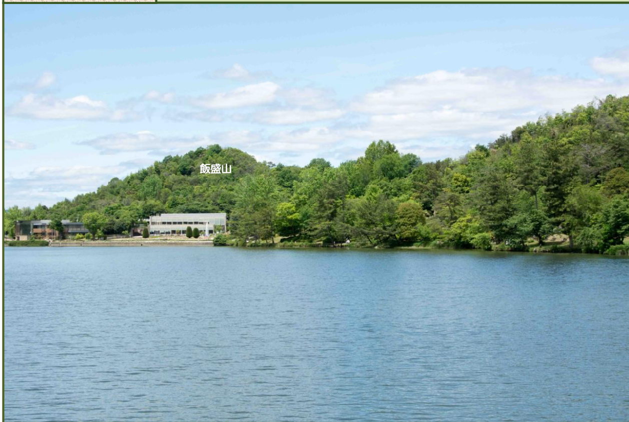
写真-1 亀ノ倉池越しに飯盛山を撮影（令和2年5月）