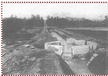
写真-4 初期の第1分水口 (『沿革誌』から引用)

なお、疏水路は老朽化に伴い漏水が多くなってきたことから、昭和14(1939)年度に改修に着手、太平洋戦争による中断を経て、昭和25(1950)、26(1951)年度にコンクリート製に改築されている。