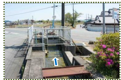
写真-6 第3分水口 (サイフォン併設)