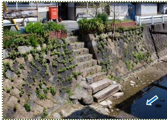
写真-10 八代本町に残る舟着場跡

現在残っている舟着場は、八代本町2丁目のものだけです(写真-10)。ちょっと勾配がきつそうです。