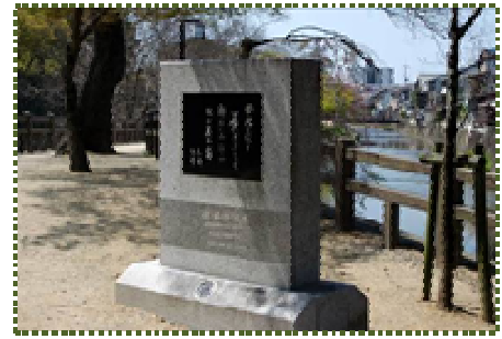
写真-13 忠刻・千姫の歌碑