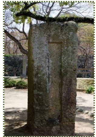
写真-3 船場川改修記念碑

後者の竣工の時期については、『姫路謂レ記』に、「河を城の西に開き掘て舟の通路となし船場川と名付く、橋五つを掛け、人之往来を休め市町を構賑す、其内に市ノ橋と云あり、此橋上下材木町・小利木町の市場をなす故、橋の名とす。」と記しています。流れから言うと、まず船場川を開削して飾磨津までの舟路を確保し、その後順次橋を架けていったと考えれば、舟路竣工が元和7(1621)年、橋を含めた全工事の竣工が寛永(1624)元年ということになりますが、約3年のタイムラグはちと長いですね。