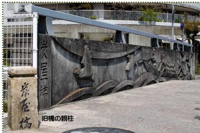
写真-7 炭屋橋の高欄に描かれた高瀬舟（左端に旧炭屋橋の親柱）

舟入川に架かる炭屋橋の高欄には、往時を偲んで高瀬舟が描かれています（写真-6）。漕ぎ手は3人、積み荷の米俵は、川を下って飾磨津まで運ばれます。『姫路市史・第三巻』によると、「この港は水深が浅いために西廻りの千石船は入港できないことから、飾磨船という小船によって大坂などへ物資の輸送をしていた」とあります。