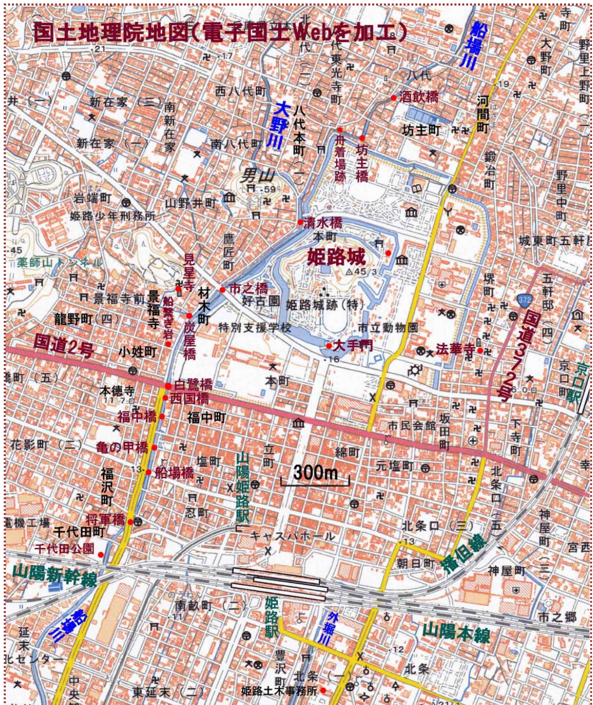
図-1 姫路城の西を流れる船場川周辺の地図

船場・城西地区は旧西国街道沿いに発達してきたところで、船場川の舟運が盛になると川沿いに多くの商家が軒を連ね、ずいぶん賑わったそうですが、平成 13 (2001) 年 11 月、日赤病院が国道 2 号・夢前橋の東に移転してからは人通りがめっきり少なくなってしまいました。