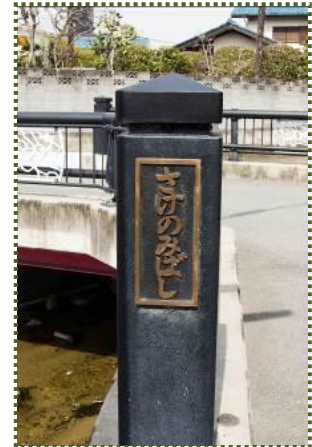
写真-15 「さけのみばし」です。