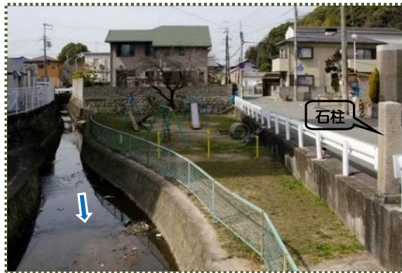
写真-5 炭屋橋から舟入川を撮影

舟入川は、飾磨津と清水門の間を上り下りする高瀬舟が交替するための停泊場であり積荷場で、明治初期までは水深も相当あったとか。