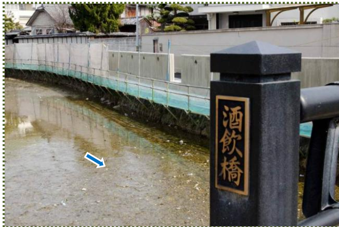
写真-14 船場川に架かる酒飲橋の親柱

この橋は、国道 2 号・白鷺橋の下流約 400m のところに架かっている橋(図-1 参照)で、近くに本多忠政の設計に基づいたという亀の甲堰があったそうです。船場川に割石で亀の甲形の堰を築いて水位を上げ、備前門から外堀となった東側の堀に水を送る役目をしたと考えられています。高瀬舟が通るので、船通しはあったんでしょうね。