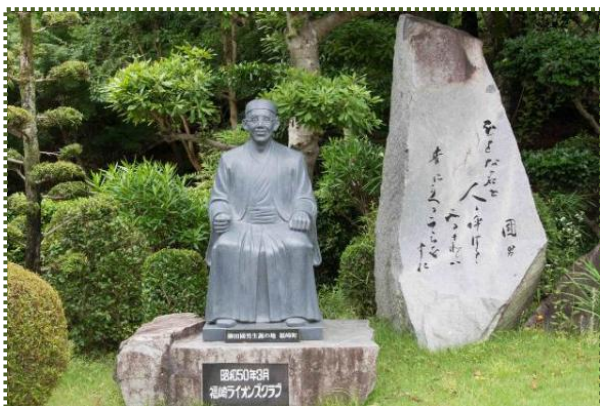
写真-2 辻川山公園内の柳田國男像

この石橋は、橋長 5.6m、橋幅 5.1m、2 径間の桁橋で、橋の横に立つ案内板には写真-3 のように記されています。