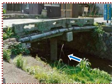
写真-5 巖橋上流側