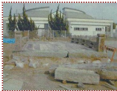
写真-7 保管場所での仮組状況

倒れかけていた親柱も立派に復元され、さまざまな字体で刻まれた橋名は堂々としていて風格が感じられます。(写真-9～12)