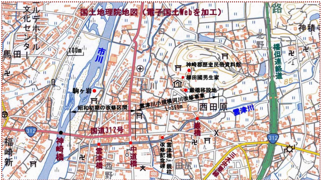
図-1 雲津川整備全体図

一方、雲津橋の親柱は、正面に「雲津橋」と刻まれ、右側面に「維時明治十一載戊寅十二月架之」、左側面に工事に関わった橋梁工や石工等の氏名、背面に金壹円以上の寄付者名（35名）が刻まれています。（雲津橋の位置は図-1 のとおり）明治 11（1878）年架橋ということですが、橋梁型式は不明です。昭和初期の河川改修の際に架け替えられ、旧橋の親柱が記念に残されたものと思われます。