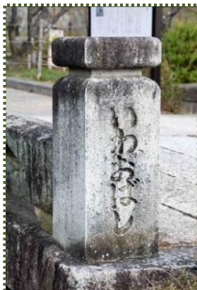
写真-10 親柱②「いわおばし」