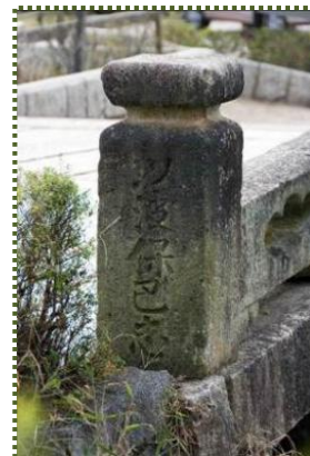
写真-12 親柱④「以波保巴志」