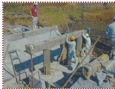
写真-8 本組状況