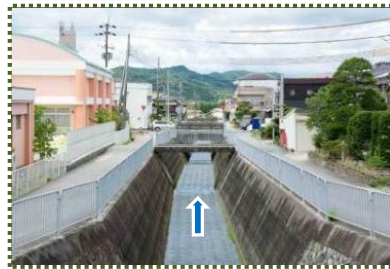
写真-14 田原幼稚園北を流れる雲津川 (田原幼稚園は田原小学校の跡地にある)