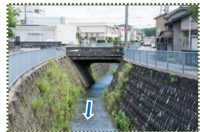
写真-15 雲津橋と雲津川

※2 御大典：即位式の後に、五穀豊穡を感謝し、その継続を祈る一代一度の大嘗祭が行われる。即位式・大嘗祭と一連の儀式を合わせ御大礼（ごたいらい）または御大典（ごたいてん）と称される。昭和天皇の御即位式は、昭和 3（1928）年 11 月 10 日に京都御所にて行われた。