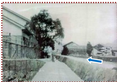
写真-13 昭和30年代、田原小学校北を流れる雲津川