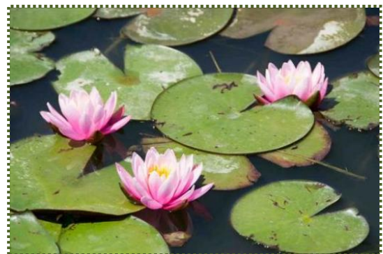
写真-19 辻川山公園内の池に咲いたスイレンの花

英名：water lily。スイレン科の属の一つで水生多年草。日本にはヒツシグサ（水草）の 1 種類のみ自生する。白い花を午後、未の刻ごろに咲かせることからその名が付いたと言われ、日本全国の池・沼に広く分布している。睡蓮はヒツシグサの漢名であるが、一般にスイレン属の水生植物の総称として用いられる。水位が安定している池などに生息し、地下茎から長い茎を伸ばし、水面に葉や花を浮かべる。葉は円形から広楕円形で円の中心付近に葉柄が着き、その部分に深い切れ込みが入る。葉の表面に強い撥水性はない。多くの植物では気孔は葉の裏側にあるが、スイレンでは葉の表側に分布する。根茎から直接伸びる花柄の先端に直径 5～10cm ほどの花をつける。