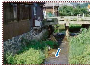
写真-6 雲津川に架かる巖橋