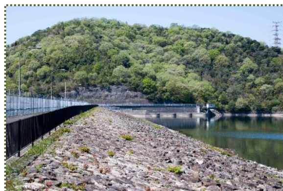
写真-8 ロックフィル型式の権現ダム