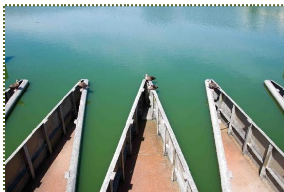
写真-5 福井大池のステンレス製ラピリンス堰