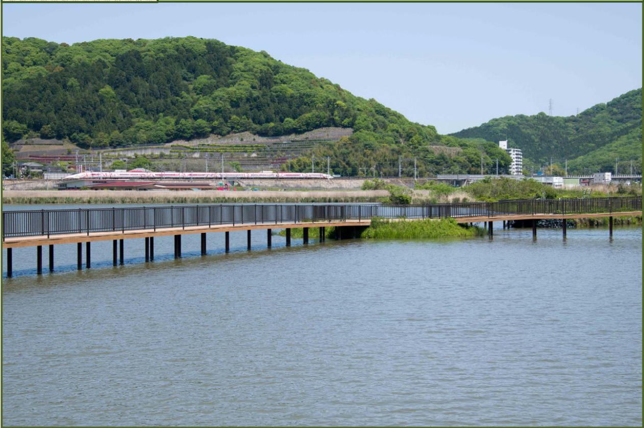
写真-1 福井大池（令和4年4月撮影）