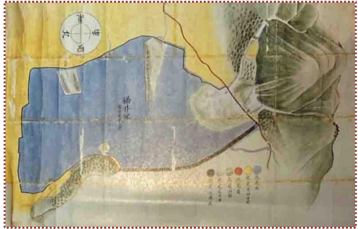
図-3 嘉永6年の原大池絵図（『太子町を描く～絵図の世界』から引用）

結局、双方妥協することで4人の仲介者を入れて翌6（1853）年4月22日に14条にわたる「仮法対談取替書」を取り交わして争論に終止符を打ちました。