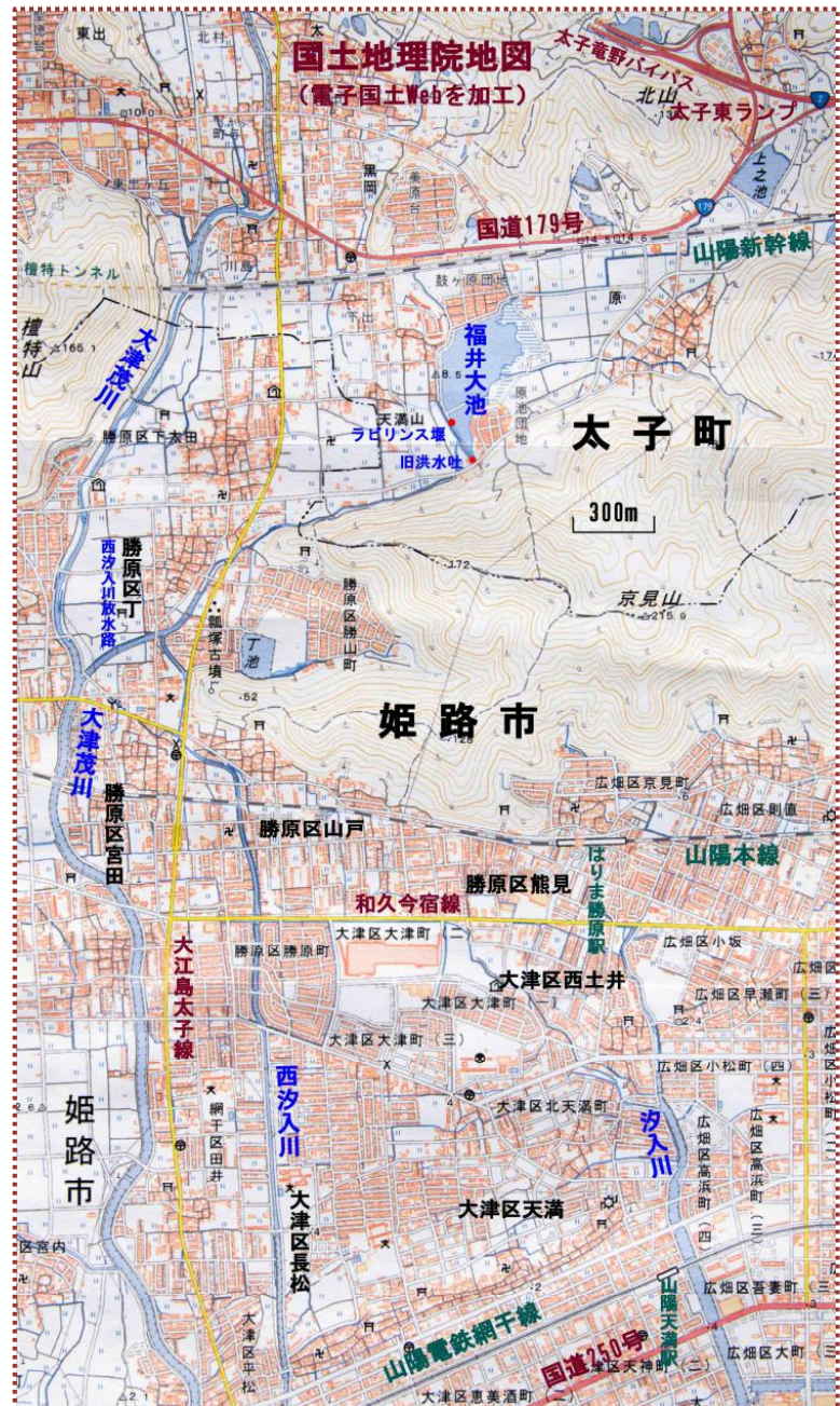
図-1 福井大池周辺の地図

※4 三左衛門事件：源頼朝急逝直後の正治元（1199）年 2 月、一条能保・高能父子の遺臣が権大納言・源通親（土御門通親）の襲撃を企てたとして逮捕された事件。「三左衛門」とは、捕らえられた後藤基清、中原政経、小野義成がいずれも左衛門尉であったことに由来する。