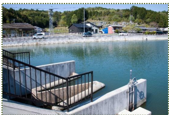
写真-6 福崎町の鴻ノ池 (前方の道路は三木穴栗線)