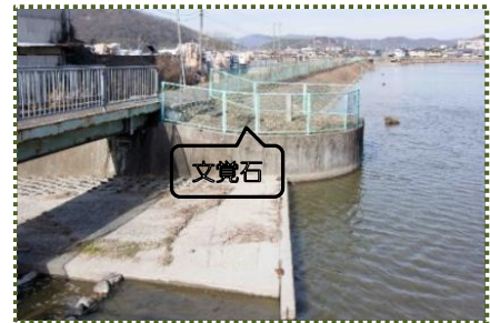
写真-3 福井大池の旧洪水吐

宝永元 (1704) 年、原村と池郷六ヶ村 (丁村は池郷六ヶ村との用水論争で和談が成立しているのが除外) との間に争論が起こります。争点その 1 は「原村が池際に新田を造って池床を狭めたかどうか」、その 2 は「うてみ (洪水吐) 口の高さ」の問題でした。