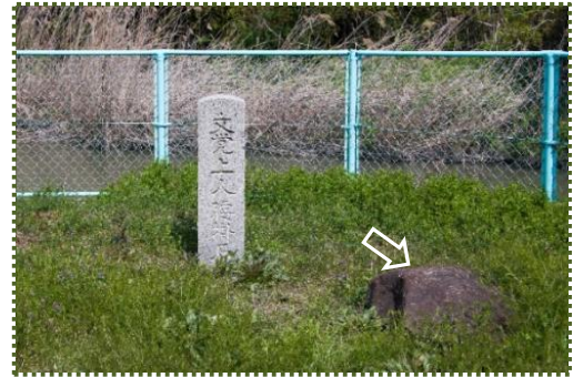
写真-2 文覚上人腰掛石（文覚石）

鎌倉時代に太田荘の代官が米を多く取るために福井大池の一部を埋め立てて新田をつくらうとしたことから、これに上人が激怒して橘定康宛てに出した抗議文書が前出の手紙です。わずか 4、5 町の新田をつくるために、福井荘の田 170 町が干害を被ることを心配しての抗議です。