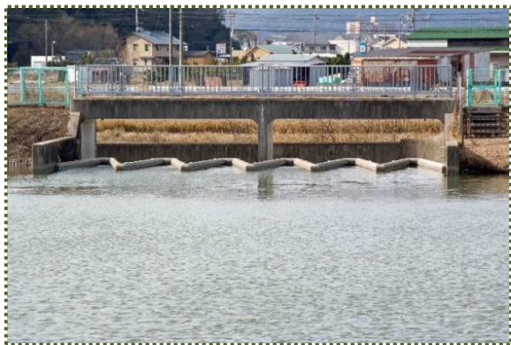
写真-4 福井大池のラピリンス堰

また、県の企業庁が管理している加古川水系の右支川・権現川に建設された権現ダムの非常用洪水吐がこの型式を採用しています。権現ダムは昭和 56 (1981) 年度に完成した工業水道専用ダムです。(写真-8-9)