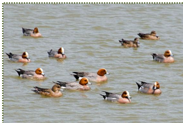
写真-10 福井大池の水面を泳ぐヒドリガモ

カモ科マガモ属に分類され、オナガガモ、マガモ、コガモなどと並んで、日本で最も普通に見られるカモ類。オスの頭部は茶褐色で、和名はこの羽色を緋色にたとえたことに由来する。日本では冬鳥として全国に渡来、越冬時は、湖沼、池、河川、河口、海岸、干潟などに生息する。食性は植物食であるが、水生昆虫や軟体動物を食べることもある。