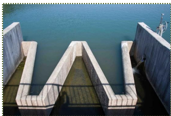
写真-7 鴻ノ池のラピリンス堰