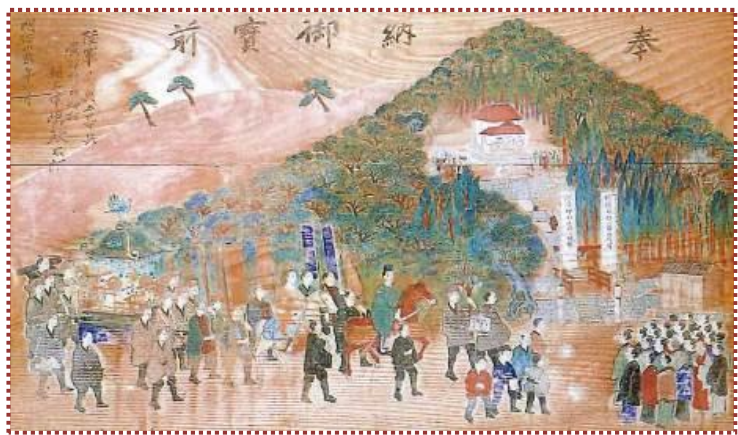
写真-17 齋神社へ奉納のお走り祭り絵馬（『養父町史』から引用）

但馬五社明神が円山川の開発について話しかった床尾山（とこのおさん）や円山川下流部が一望できる来日岳（くるひだけ）に登ってみたい気もしますが、そのためには、まず体重を何とかしないと…。体力は落ちる一方ですが、体重はなかなか落ちてくれません。