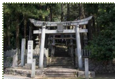
写真-6 齋神社到着「やっと折り返しや」