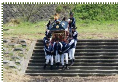
写真-3 ウッ、重いなあ！！