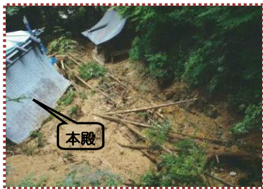
写真-12 斎神社本殿周辺の被災状況

平成 21 (2009) 年 8 月の台風 9 号の影響で、建屋川上流域では 24 時間雨量 224mm、最大時間雨量 60mm (養父市長野観測所) を記録しました。この豪雨により“土木の神様”彦狭知命 (ヒサカリノミコト) を祀る斎神社の裏山で山腹崩壊が発生、多量の土砂と倒木が流出し、山の中腹に立つ斎神社の本殿や拝殿・幣殿※4 (ハいでん) が倒壊しました。土砂は、境内を 1~2m の深さに埋めて、さらに山麓を走る県道 70 号養父朝来線にまで達し、県道の通行にも支障が生じました。