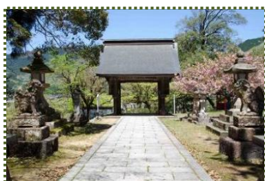
写真-5 養父神社を出発「はっとう・・・」

養父神社から齋神社への巡幸ルートは下図-2の通りです。昔は、2日かかりとはいえ神輿を担いで全行程を歩いたそうですが、やがて地区間の移動は馬を使うようになり、それが人力車に変わり、今では自動車を利用しています。担ぎ手の高齢化、若者の減少による担ぎ手不足も影響しているのでしょうか。