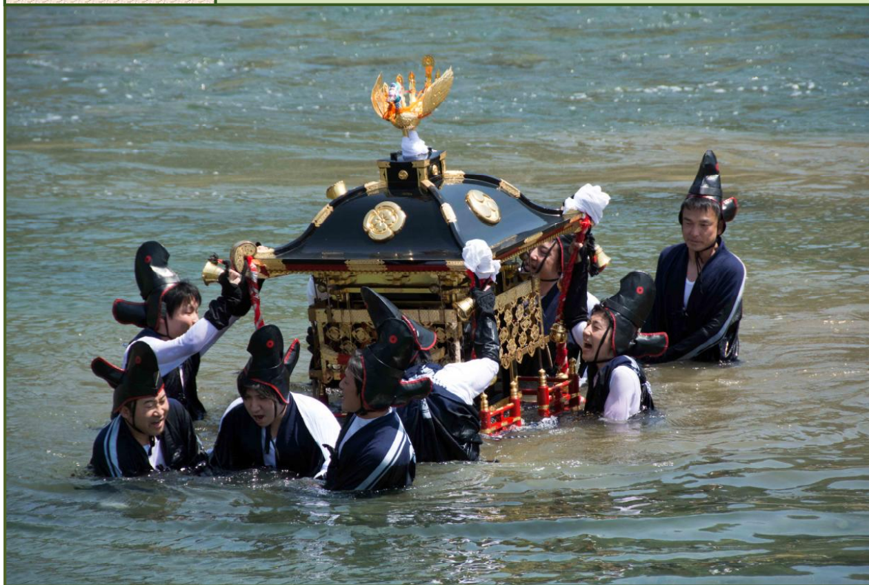
写真-1 大屋川の川渡御（小城橋上流にて平成27年4月撮影）