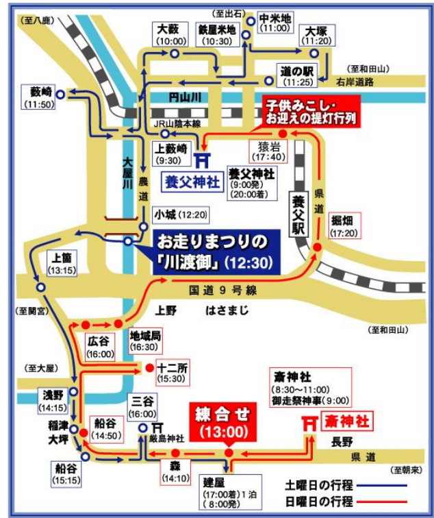
図-2 お走りの巡幸ルート

養父神社を出発した神輿は、養父市三谷の厳島神社で斎神社の神輿と合流し練りあった後、養父市建屋で一泊。斎神社に参った後、再び建屋で2台の神輿は練り合って別れを惜しみ、それぞれの神社へと帰っていきます。