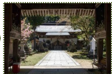
写真-7 翌日養父神社本殿帰着「ヤレヤレ」