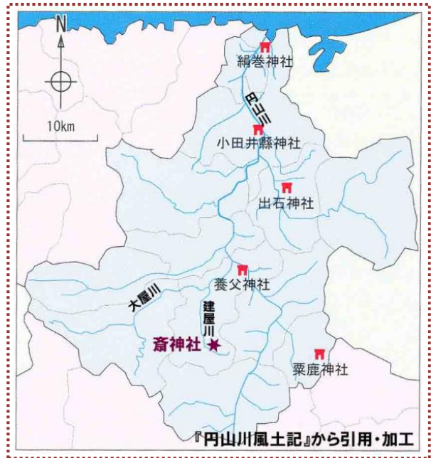
図-1 但馬明神五社位置図

お走り祭りは、この故事に因んで養父神社から齋神社へ「瀬戸開きのお礼参り」をするものです。しかし、旧暦の師走というのは厳寒期にあたるのでそんな時期に川渡御をするなんてとんでもないということで、明治10（1877）年からは4月15日・16日に変更されました。さらに、平成に入って以降のある時期から4月中旬の土日に変更されています。これは、担ぎ手の都合もありますが、大勢のギャラリーの中で川渡御をするほうが頑張れる、という意図もあってのことだそうです。