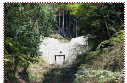
写真-16 完成した治山堰堤 (下流面)