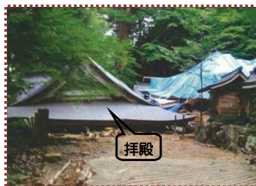
写真-13 斎神社拝殿の被災状況