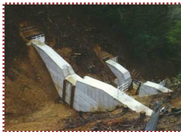
写真-15 完成した治山堰堤 (上流面)

崩壊発生後の溪流には不安定土砂や流木がかなり残っていたことから、溪流対策および流木対策を講じることとし、平成 22 (2010) 年 8 月から県単独緊急防災事業により谷止工 1 基、流木捕捉工 (スリットダム) 1 基、土留工等を実施、平成 23 (2011) 年 3 月に完成しました。