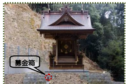
写真-14 完成した本殿

崩壊発生後の溪流には不安定土砂や流木がかなり残っていたことから、溪流対策および流木対策を講じることとし、平成 22 (2010) 年 8 月から県単独緊急防災事業により谷止工 1 基、流木捕捉工 (スリットダム) 1 基、土留工等を実施、平成 23 (2011) 年 3 月に完成しました。