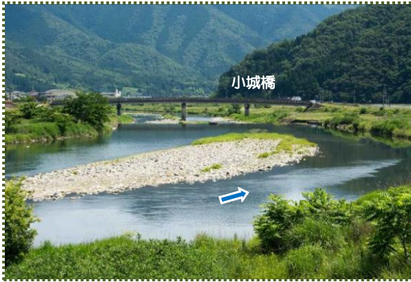
写真-8 広谷大橋から大屋川下流を撮影

養父神社を出発した神輿は、養父市三谷の厳島神社で斎神社の神輿と合流し練りあった後、養父市建屋で一泊。斎神社に参った後、再び建屋で2台の神輿は練り合って別れを惜しみ、それぞれの神社へと帰っていきます。