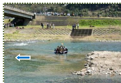
写真-4 皆見てるから、がんばるか！！