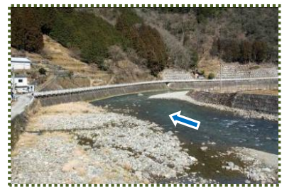
写真-11 大屋川(新津・新大亀橋から下流を望む)