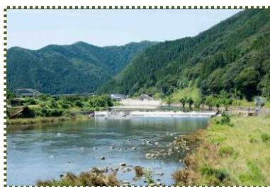
写真-9 大屋川(十二所大橋から上流を望む)

※3 牛頭天王: 日本における神仏習合の神。釈迦の生誕地に因む祇園精舎の守護神とされた。天文年間(1532~1555年)に大火災に遭い、天文15(1546)年に再建、この時に山麓の旧大屋町宮本の現在地に下されたという。巡幸ルートの変更には、この天王社の移転が関係しているのかも。